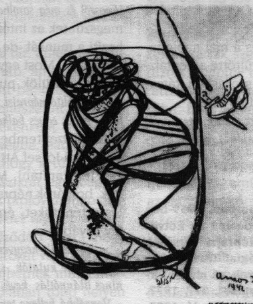
Összehasonlításképp egymás mellé téve: Marko Andlovic kompozíciója 1993-ból és Ámos Imréé 1942-ből