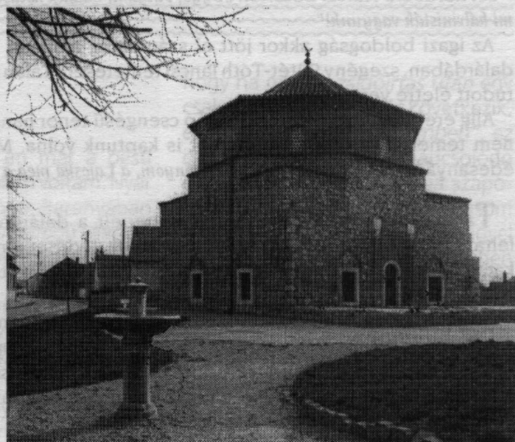
A dzsámi ma.